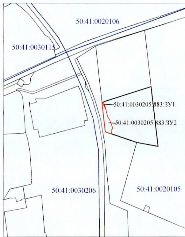
Масштаб 1:5 000 Система координат - МСК-50, зона 2