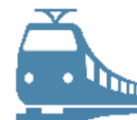
Железнодорожные пути необщего пользования