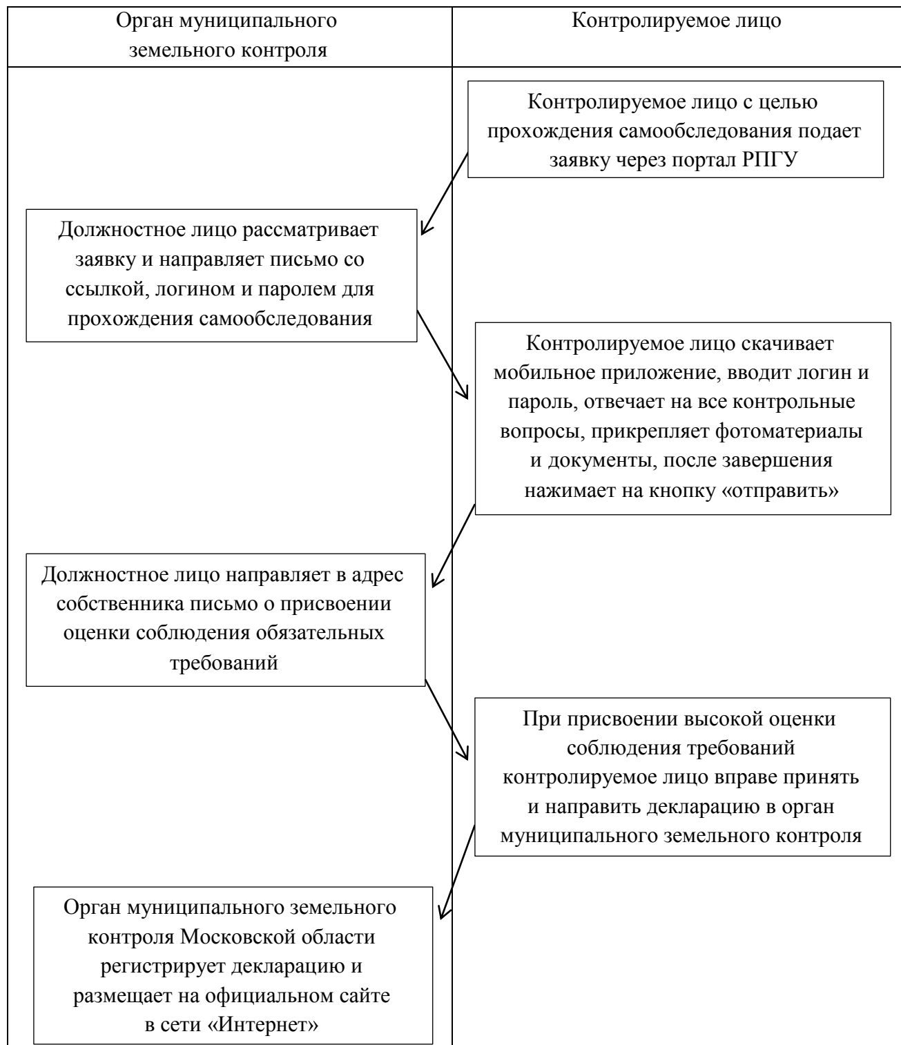
Схема организации процесса самообследования